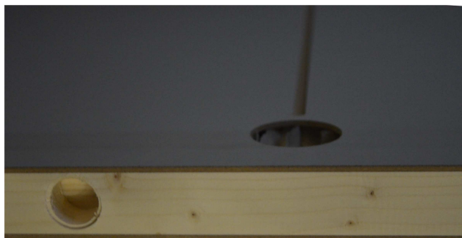
USINAGE ROSACE ET TIRE DOIGT