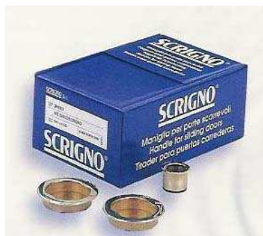
ROSACE ET TIRE DOIGT