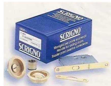
ROSACE ET TIRE DOIGT ET SERRURE